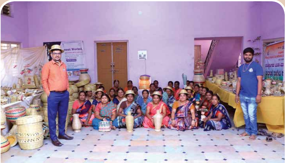
ಕೊಪ್ಪಳ ಜಿಲ್ಲೆಯ ಮೇದಾರ ಸಮುದಾಯದ ಕುಶಲಕರ್ಮಿಗಳ ತಂಡ.

Displaying 200 Bamboo products made by Young Artisans from Medar Community of Koppal District.