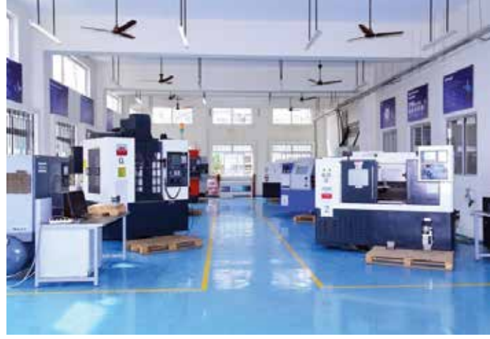
ಕೆಜಿಟಿಟಿಐ ಬೆಂಗಳೂರು ಕೇಂದ್ರದ ಸಿಎನ್‌ಸಿ ವಿಭಾಗದ ನೋಟ

AMS ಸಂಸ್ಥೆಯಲ್ಲಿ ಕೆಲಸ ಮಾಡುವುದರ ಜೊತೆಗೆ ನನಗೆ ಕರ್ನಾಟಕ ಜರ್ಮನ್ ತಾಂತ್ರಿಕ ತರಬೇತಿ ಸಂಸ್ಥೆ ಮತ್ತೊಂದು ಸುವರ್ಣಾವಕಾಶ ನೀಡಿತು. ಅದೇನೆಂದರೆ ಭಾನುವಾರದ ರಜಾ ಸಮಯದಲ್ಲಿ ಉಳಿದ ತರಬೇತಿಯನ್ನು ಪಡೆಯಲು ಅವಕಾಶವನ್ನು ಕಲ್ಪಿಸಿಕೊಟ್ಟಿತು. ಕೆಜಿಟಿಟಿಐನಲ್ಲಿ ತರಬೇತಿಯನ್ನು ಪಡೆದ ಬಳಿಕ ಆಗುವ ಪ್ರಯೋಜನಗಳ ಬಗ್ಗೆ ಅರಿತಿದ್ದರಿಂದ ನಾನು ಮತ್ತೆ ತರಬೇತಿಯನ್ನು ಪಡೆಯಲು ನಿರ್ಧರಿಸಿದೆ. ಜೊತೆಗೆ ಈ ಹಿಂದೆ ನಾನು ಪಡೆದಿದ್ದ ವಿಷಯಗಳ ಕುರಿತು ತರಬೇತಿಯನ್ನು