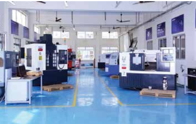
KGTI Bengaluru Centre CNC Department View.