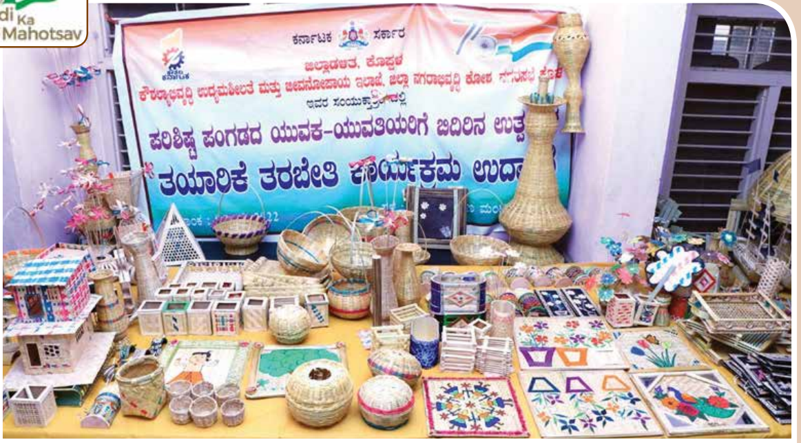
ಕೊಪ್ಪಳ ಜಿಲ್ಲೆಯ ಮೇದಾರ ಸಮುದಾಯದ 200 ಯುವ ಕುಶಲಕರ್ಮಿಗಳು ತಯಾರಿಸಿದ ಬಿದಿರು ಉತ್ಪನ್ನಗಳನ್ನು ಮಾರಾಟ ಮಳಿಗೆಯಲ್ಲಿ ಪ್ರದರ್ಶಿಸುತ್ತಿರುವುದು.

Displaying 200 Bamboo products made by Young Artisans from Medar Community of Koppal District.