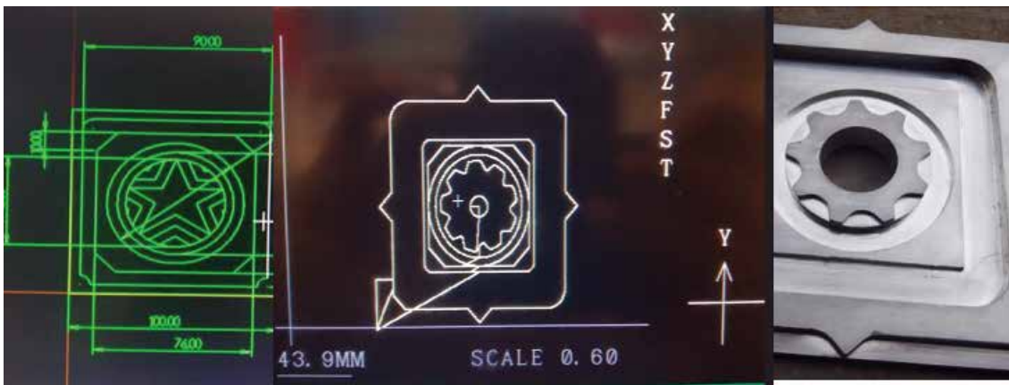
Some of the CNC Module I designed and created during the training period at KGTTI, Bengaluru.

In the meantime, the money I needed for the Diploma course came from my