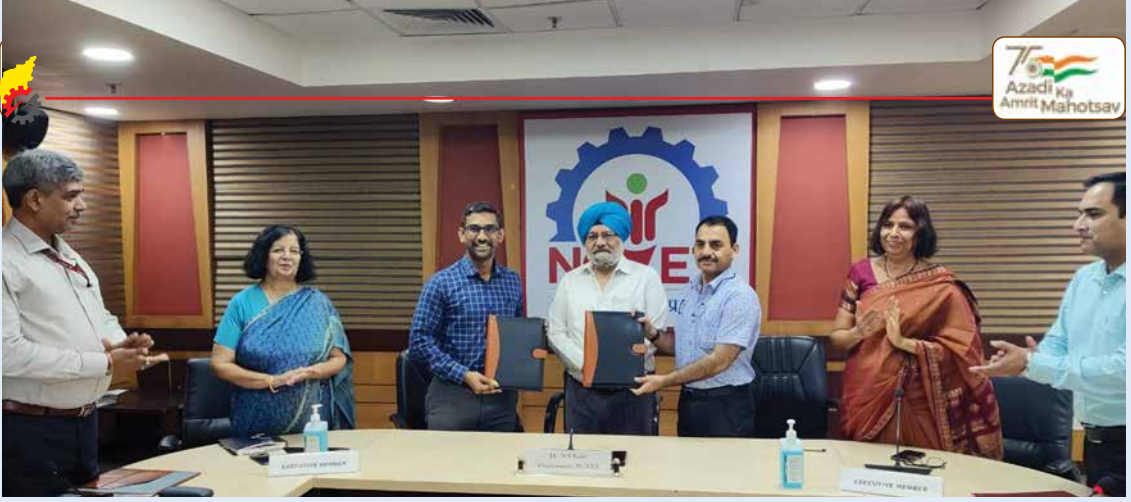
MD, KSDC and Director, NCVET exchange MoUs