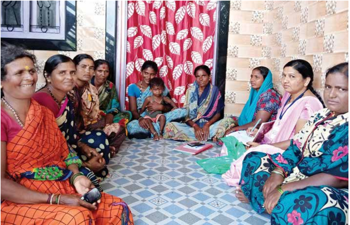
ಸಾಮಾನ್ಯ ಸಂಪನ್ಮೂಲ ವ್ಯಕ್ತಿಗಳ ಗುರುತಿಸುವಿಕೆ ಹಾಗೂ ಸ್ವ-ಸಹಾಯ ಗುಂಪುಗಳ ಸಂಭಾವ್ಯ ಉದ್ಯಮಿಗಳ ಸಭೆ

ತಾಲೂಕು ಮಟ್ಟದಲ್ಲಿ ಮೀಸಲಾದ ತಾಲೂಕು ಸಂಪನ್ಮೂಲ ಕೇಂದ್ರ - ಉದ್ಯಮ ಪ್ರಚಾರವನ್ನು ಸ್ಥಾಪಿಸಲಾಗುವುದು. ಪ್ರಾರಂಭಿಕ ಗ್ರಾಮೀಣ ಉದ್ಯಮಶೀಲ ಕಾರ್ಯಕ್ರಮವನ್ನು ಅನುಷ್ಠಾನ ಗೊಳಿಸಲು ತಾಲೂಕು ಸಂಪನ್ಮೂಲ ಕೇಂದ್ರವು