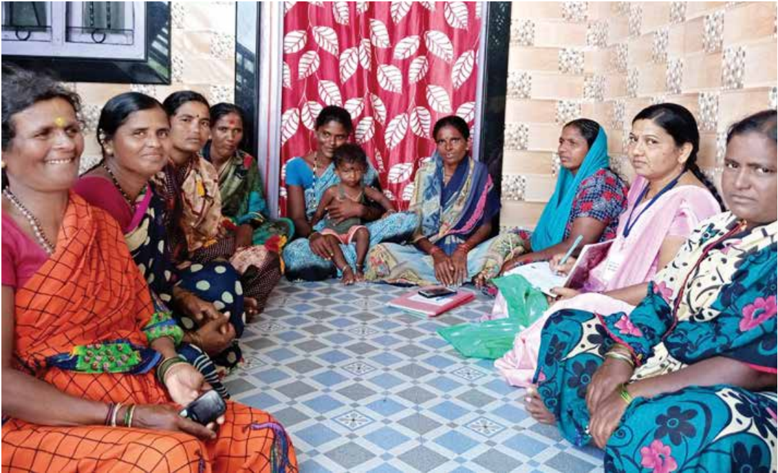
CRP-EP identifying the potential Entrepreneurs in the SHG Meetings