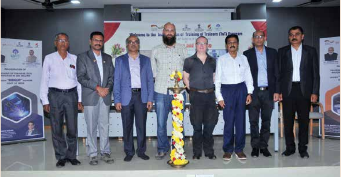
ToT program inauguration at KGTTI Bengaluru with German Experts