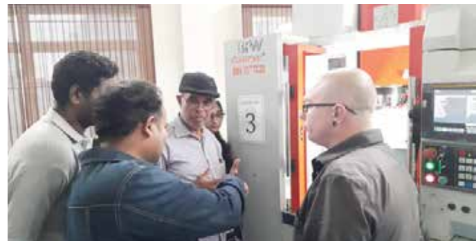
CNC ಮತ್ತು ವೆಲ್ಡಿಂಗ್‌ನ ಸೂಕ್ಷ್ಮ ವೃತ್ತಾಸಗಳನ್ನು ವಿವರಿಸುತ್ತಿರುವ ಜರ್ಮನ್ ತಜ್ಞರು.