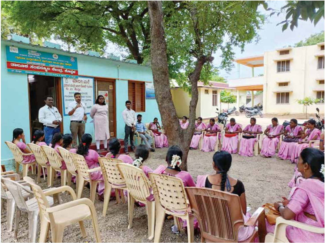
SVEP Taluk Resource Centre in Koppal taluk in Koppal district.

and will cover manufacturing, services and trading. These enterprises will cover traditional skills as well as new skills.