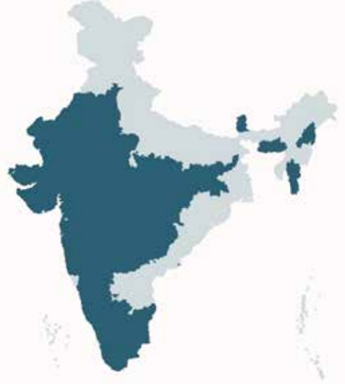
Participant States / UTs under Quality in Skilling

ಕುರಿತು ನೀತಿ ಹಾಗೂ ಸಾಂಸ್ಥಿಕ ಬದಲಾವಣೆಗಳನ್ನು ಉತ್ತೇಜಿಸಬೇಕೆಂದು ತೀರ್ಮಾನಿಸಲಾಯಿತು.