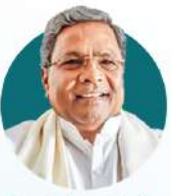
ಶ್ರೀ ಸಿದ್ದರಾಮಯ್ಯ ಮಾನ್ಯ ಮುಖ್ಯಮಂತ್ರಿಗಳು, ಕರ್ನಾಟಕ ಸರ್ಕಾರ