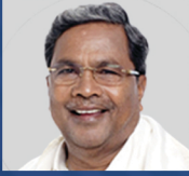
Shri Siddaramaiah Hon'ble Chief Minister, Government of Karnataka