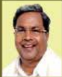
SHRI SIDDARAMAIAH Hon'ble Chief Minister, Government of Karnataka