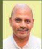
DR SHARANAPRAKASH RUDRAPPA PATIL Hon'ble Minister for Medical Education and Skill Development, Entrepreneurship and Livelihood

DEPARTMENT OF SKILL DEVELOPMENT, ENTREPRENEURSHIP AND LIVELIHOOD KARNATAKA SKILL DEVELOPMENT CORPORATION